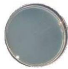
mit Puremanent behandelt