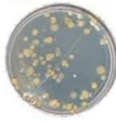
mit konventionellen Desinfektionsmitteln