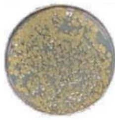
mit Wasser gereinigt